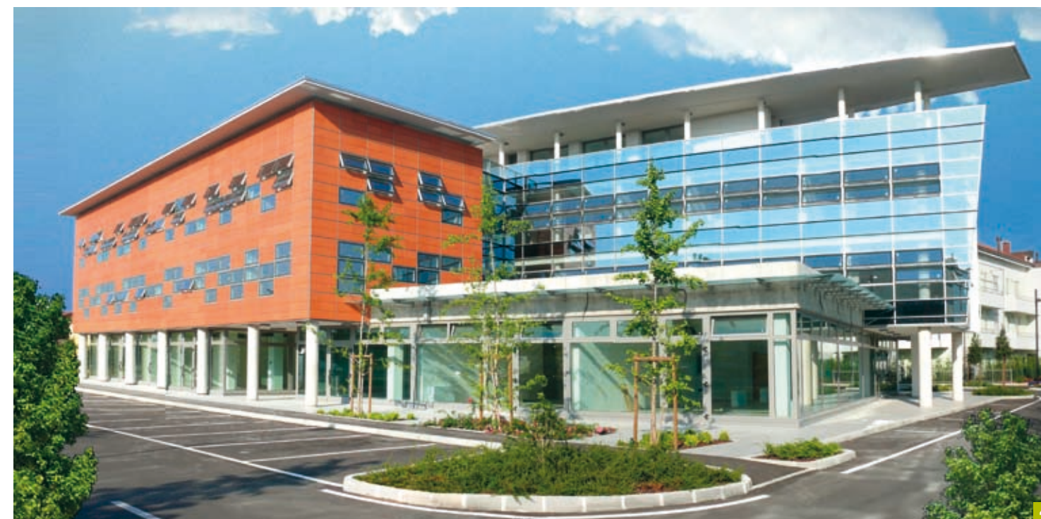
3. 4. Management Centre, Mestrino (PD); designed by Tecnostudio — architects Arianna Gobbo and Danilo Turato, cladding material Zephir® Terreal Rosso Arancio Liscio, structure by Abaco Solutions